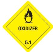
Oxidizer Symb.-Nr. 502