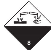
Ätzende Stoffe Symb.-Nr. 800