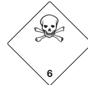
Giftige Stoffe Symb.-Nr. 600