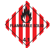
Flammable Solid Symb.-Nr. 404