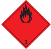
Entzündbare flüssige Stoffe Symb.-Nr. 300