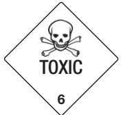
Toxic Symb.-Nr. 602