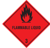
Entzündbare Gase Symb.-Nr. 302