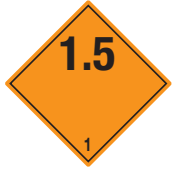
Explosive Stoffe Symb.-Nr. 109