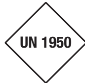
UN ... * Symb.-Nr. 952