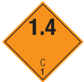
Explosive Stoffe Symb.-Nr. 101