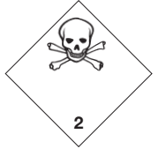
Giftige Gase Symb.-Nr. 204