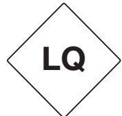
Limited Quantities Symb.-Nr. 950