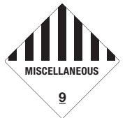
Miscellaneous Symb.-Nr. 901