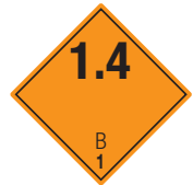
Explosive Stoffe Symb.-Nr. 100