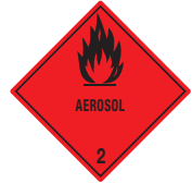
Aerosol Symb.-Nr. 205