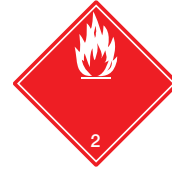
Entzündbare Gase Symb.-Nr. 201