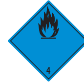
Entzündliche Feststoffe (wasseraktiv) Symb.-Nr. 402