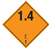
Explosive Stoffe Symb.-Nr. 103