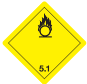
Entzündlich wirkende Stoffe Symb.-Nr. 500