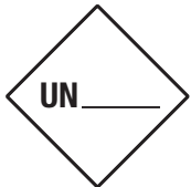
UN zur Selbstbeschriftung Symb.-Nr. 951