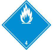
Entzündliche Feststoffe (wasseraktiv) Symb.-Nr. 403