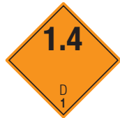
Explosive Stoffe Symb.-Nr. 102