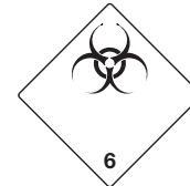
Ansteckungsgefährliche Stoffe Symb.-Nr. 601