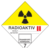
Radioaktive Stoffe Klasse 2 Symb.-Nr. 701