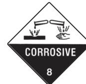
Ätzende Stoffe Symb.-Nr. 801