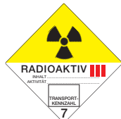
Radioaktive Stoffe Klasse 3 Symb.-Nr. 702