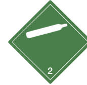
nicht entzündbare nicht giftige Gase Symb.-Nr. 203