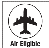
Air Eligible Symb.-Nr. 953

Sie erhalten die Gefahrgut-Etiketten wie folgt: