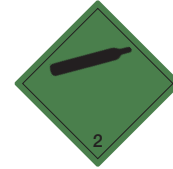
Nicht entzündbare nicht giftige Gase Symb.-Nr. 202