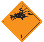
Explosive Stoffe Symb.-Nr. 107