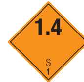
Explosive Stoffe Symb.-Nr. 106