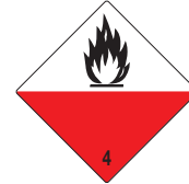
Selbstentzündliche Stoffe Symb.-Nr. 401