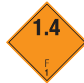
Explosive Stoffe Symb.-Nr. 104