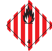
Entzündbare feste Stoffe Symb.-Nr. 400