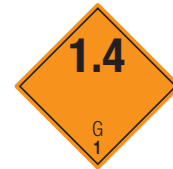
Explosive Stoffe Symb.-Nr. 105