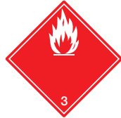
Entzündbare flüssige Stoffe Symb.-Nr. 301