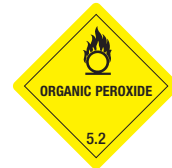
Organic Peroxide Symb.-Nr. 503