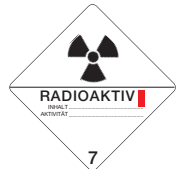
Radioaktive Stoffe Klasse 1 Symb.-Nr. 700