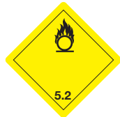
Organische Peroxide Symb.-Nr. 501